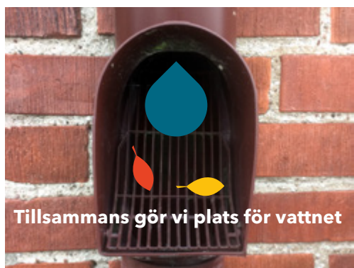
Tillsammans gör vi plats för vattnet

Nu är det dags att kontrollera att stuprör och hängrännor är hela och sitter som de ska. Kom också ihåg att rensa dem från löv och skräp. Rännsil, lövfångare och regntratt minskar risken för stopp. När vattnet kan rinna iväg fritt minskar också risken för översvämning.